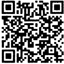
สิ่งที่ส่งมาด้วย ๑