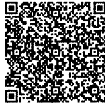
สิ่งที่ส่งมาด้วย ๓