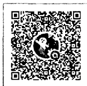
กลุ่มไลน์

** ทั้งนี้ ขอให้ทุกท่านเข้ากลุ่มไลน์เพื่อสอบถามข้อสงสัย หรือแลกเปลี่ยนข้อมูลต่าง ๆ โดย SCAN QR CODE ด้านล่าง