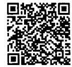
ประกาศรายชื่อ