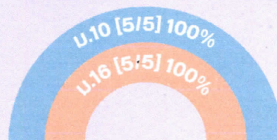
หน่วยงานอื่นของรัฐ