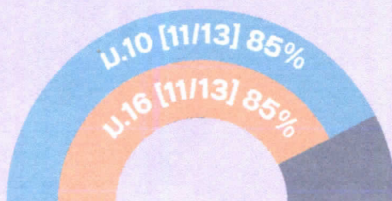
หน่วยงานของรัฐรูปแบบใหม่