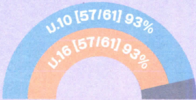
องค์การมหาชน