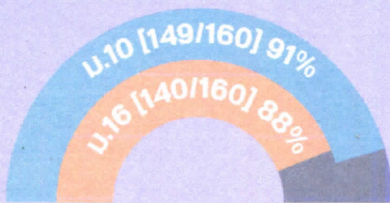
ส่วนราชการ