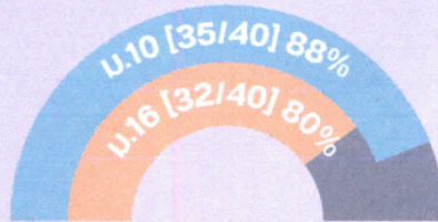
รัฐวิสาหกิจ