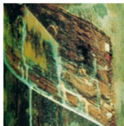
อาการเส้นดำบริเวณต้นยางพารา