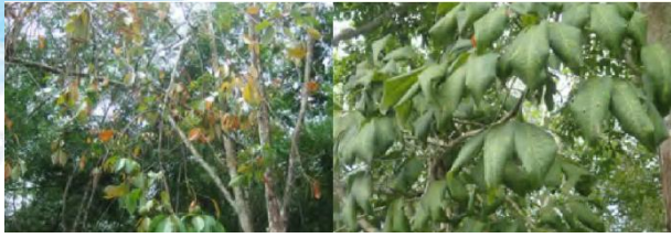
อาการใบเหลืองและขอบใบห่อลง