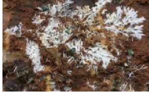
เส้นใยสีขาวของเชื้อรา