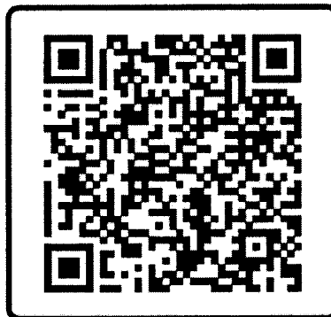
QR Code แบบประเมินโครงการ